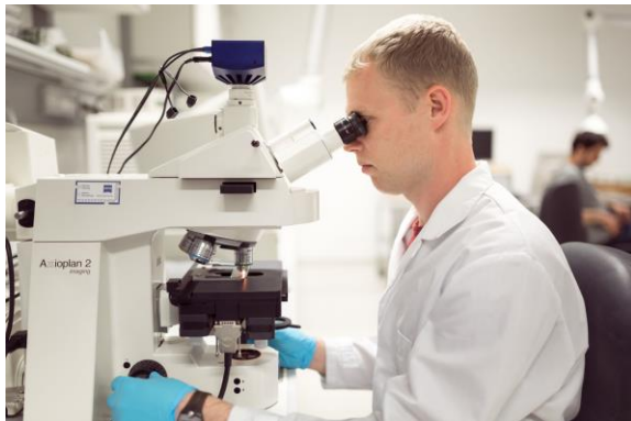
Abb. 1: Leimdetektion mittels Fluoreszenzlichtmikroskopie (Wood K plus)

Die entwickelten Methoden für die Untersuchung der Harzverteilung, wurden bereits im Rahmen von vier Publikationen in wissenschaftlichen Fachzeitschriften veröffentlicht